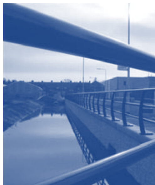
Waterverbinding tussen de P.C. Hoofthoofaan en de Weteringsingel.