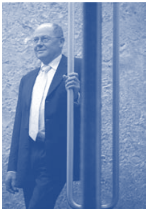
De heer Van der Sar, gedeputeerde van de provincie Zuid-Holland.