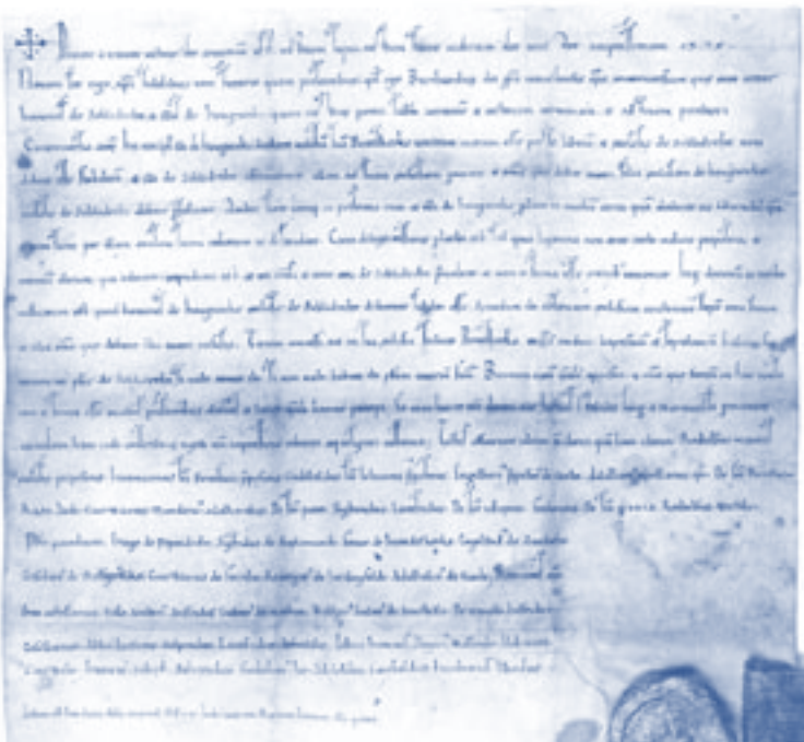
Archiefstuk waarop Papendrecht voor het eerst wordt genoemd.

seren. In de loop van 2004 moet Papendrecht 900 verder gestalte krijgen, onder meer door een speciaal voor Papendrecht 900 ontworpen logo. In mijn nieuwjaarstoespraak riep ik eenieder, individuele burgers, maatschappelijke instellingen en ondernemers, op om de kracht die de samenleving gezamenlijk heeft, te mobiliseren en van 2005 een "Papendrechts Olympisch jaar" te maken. Een jaar waarin we onderlinge verbondenheid en samenhang kunnen versterken en ons met recht het gevoel zal geven dat we met trots deel uitmaken van de Papendrechtse samenleving.