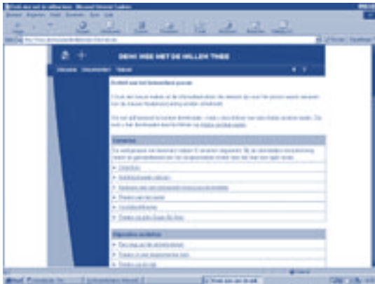
Schermafdruk van de website www.denkmeemetdewillemtwee.nl

proces voor verbetering vatbaar. Zowel voor ons bestuurders als voor u als bewoners is deze nieuwe stijl van werken een leerproces. Ik vind dat we met z'n allen, gemeente, bestuur en bewoner, erop moeten toezien dat we lessen trekken uit een evaluatie van het proces rond het nieuwe theater om deze vervolgens toe te passen in toekomstige interactieve processen.