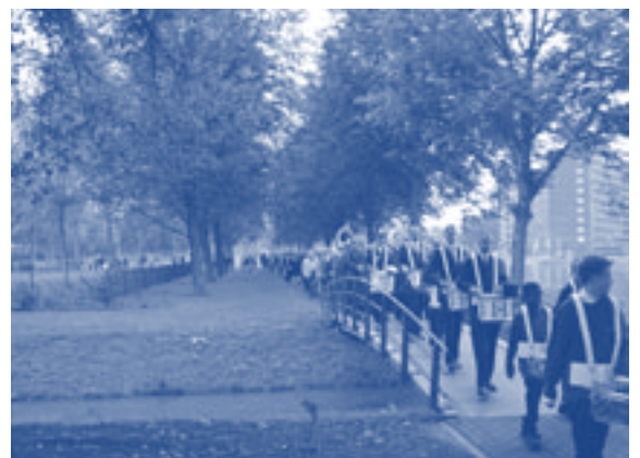
Muziekvereniging Excelsior luisterde de feestelijke opening van het Vijverpark op.